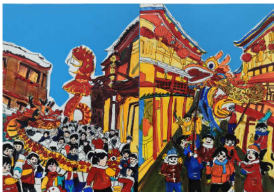
《古韵节庆欢歌》代爱轩

未来,天津市群众艺术馆将继续秉承“享受美育,全面发展”的理念,不断创新艺术教育模式,深化文化馆的全民艺术普及职能,为少年儿童打造更优质的美育空间,推动青少年美育事业持续高质量发展。