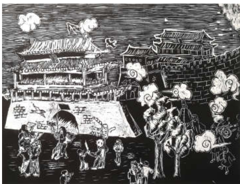
《古往今来永定门》方嘉麟