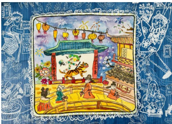
《古韵灯会盛景图》盛睿麒