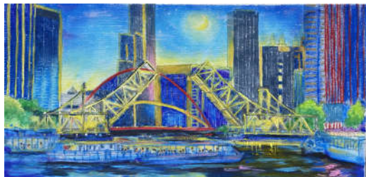
《解放桥·夜启星河渡》李玟菡