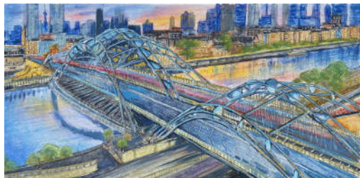
《直沽桥·暮霭华灯赋》任栩墨