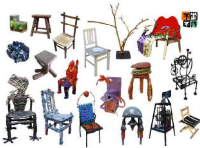
《不坐不休》天津市少年儿童活动中心

在汉语成语中，有一句“不做不休”，比喻事情既然开了头，就要干到底，这组名为《不坐不休》的立体作品，简直就是一场椅子的杂技！36 位小作者发挥想象力和创造力，运用多样的艺术媒介，利用各式各样的材料把普通的椅子打造出各种造型，自由表达对椅子的独特见解，创作出既有趣又富有深意的作品。展品中的椅子不只是静默的家具，而是孩子们情感表达和创意的载体，从朴素的小马扎到充满未来感的艺术椅子，每一件作品都凝聚着孩子们对家庭、社区、文化和梦想的深刻思考。展览以创新思维重构日常器物，藉此探索艺术与生活的多重关联性，呈现新生代对传统与现代、自然与科技关系的独特解读。