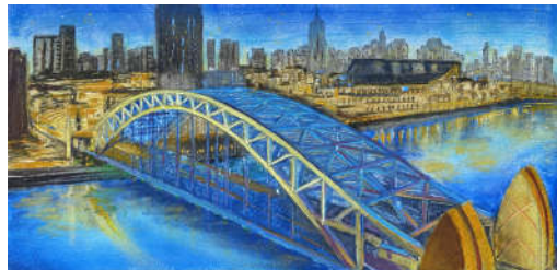
《国泰桥·万家灯火映澜章》王奕彦