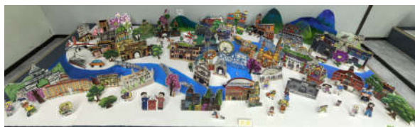
《九河下梢天津卫》天津星梦想艺术学校

这是由 32 位小作者在老师的带领下以纸艺的形式制作的立体作品《九河下梢天津卫》，集中呈现天津多元文化图景与丰富的人文风貌。作品以蜿蜒的海河为叙事轴线，巧妙串联津门新旧地标：永乐桥上“天津之眼”守望这座希望之城并见证它的不断变迁，百年解放桥与象征解放的金汤桥静卧海河碧波，意式风情区异域风韵犹存，天塔傲立云天。这组作品更像是一幅微缩画卷，诉说着天津古今交融，中西合璧的城市风貌和生生不息的发展活力，尽显这座城市在新时代的独特气韵与万千气象。