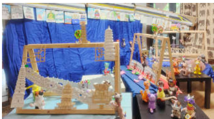
《城市漫步》心象艺术馆